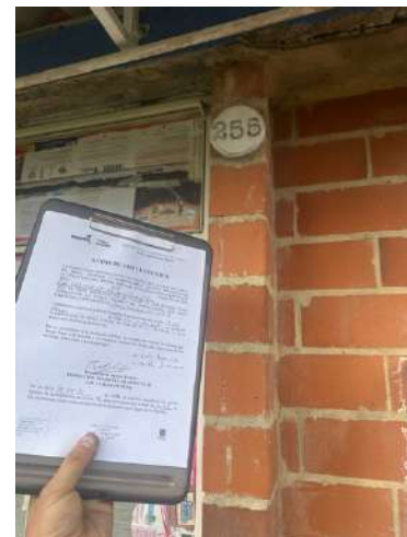
IMAGEN 2: FACHADA DEL PREDIO